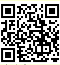
Plano de ação TEIP4 - 2024-27