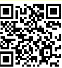
Plano de autoavaliação do AEVST